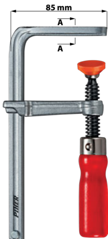
PRZEKRÓJ A - A