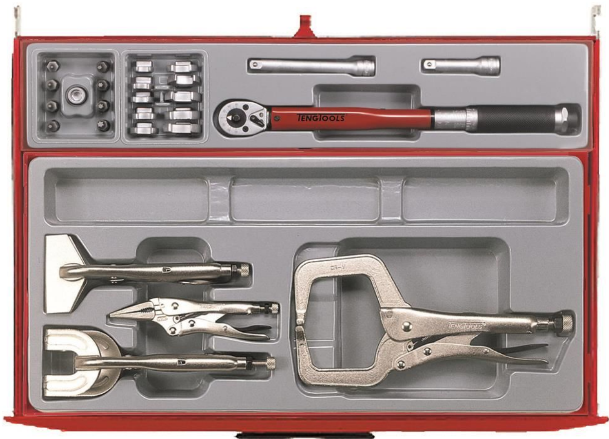
106230105 - TTPSPG - zestaw szczypiec spawalniczych 4PC 102110104 - TTX3892 - zestaw klucza dynamometrycznego z chwytem 3/8" SET