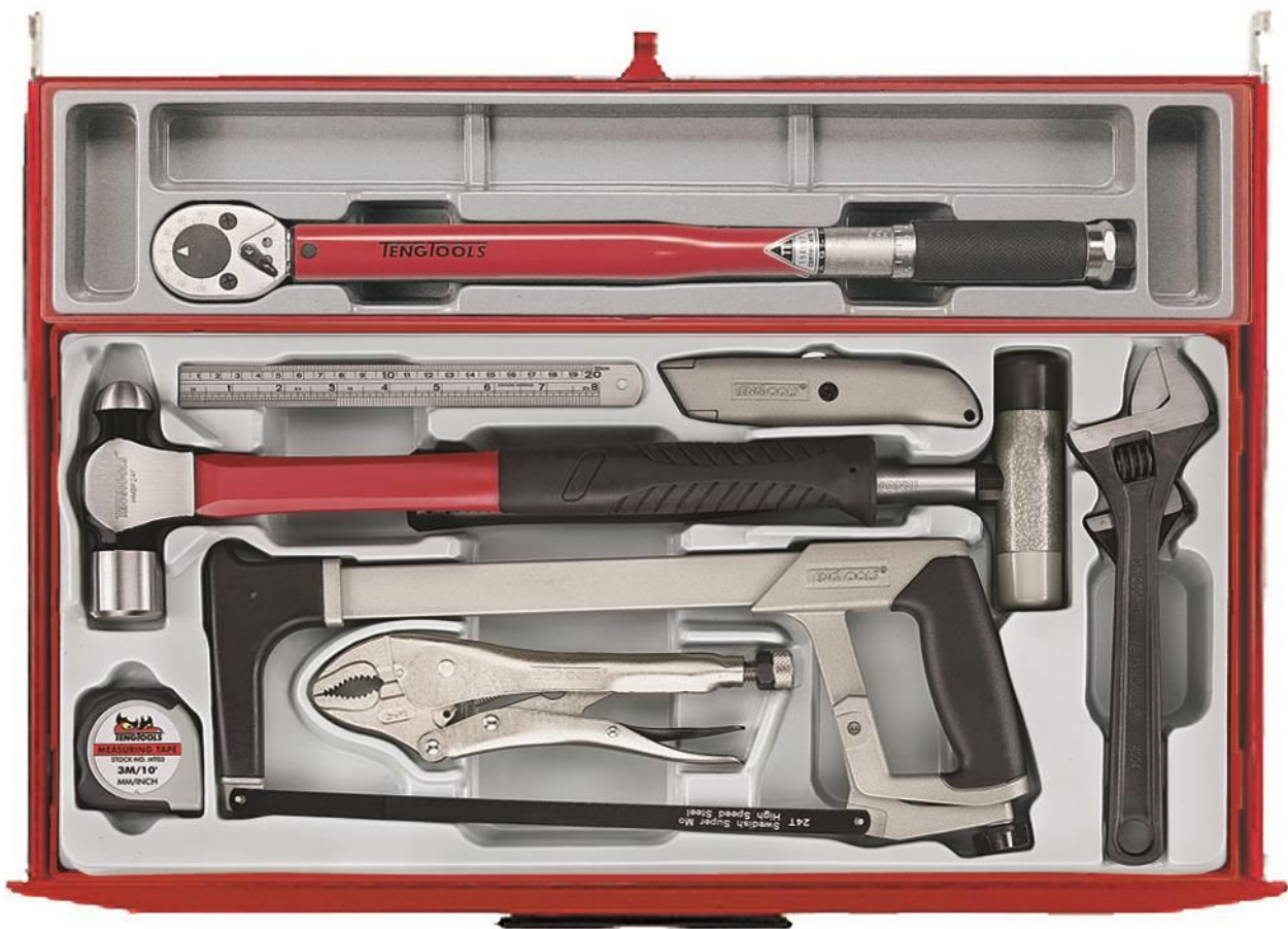
106210107 - TTPS09 - zestaw narzędzi warsztatowych 9PC 73190100 - TTX1292 - klucz dynamometryczny z chwytem 1/2"